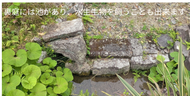
裏庭には池があり、水生生物を飼うことも出来ます